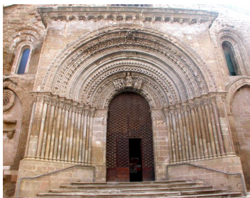
Santa Maria d'Agramunt

http://agramunt.ddl.net/secciodinamica.php?seccio=EL%20NOSTRE%20PATRIMONI&id_seccio=5338