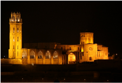
La Seu Vella de Lleida

POI 8: Carrer de Pintor Marsà, Tárrega, Catalunya, ES, 25330