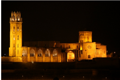
Ruta dels castells de Lleida

et les utilisations inopportunes apparurent avec l'époque moderne et les guerres à échelle européenne: la colline fut rasée et à la place, progressivement, fut bâtie une fortification militaire. Les deux seuls édifices qui ne furent pas détruits, la cathédrale et le château, furent transformés en tristes casernes militaires. Cet usage se prolongea malheureusement jusqu'en 1948. Une lente et encourageante restauration commença alors, encore aujourd'hui en cours.